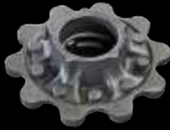
MOZZO / wheel hub