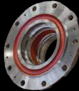
MOZZO / wheel hub