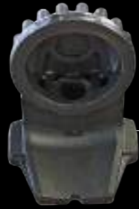
SUPPORTO / support