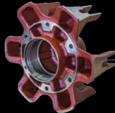
RAGGERA / spoke wheel