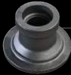
MOZZO / wheel hub