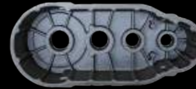
CASSA / housing