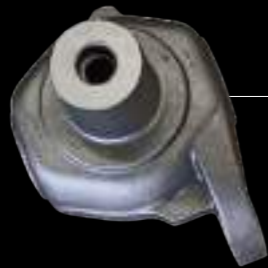
SNODO / steering knuckle