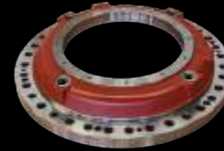
SUPPORTO FLANGIA / flange