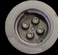
PORTASATELLITE / planetary carrier