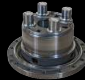
MOZZO / wheel hub