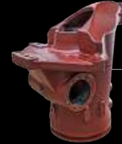
SUPPORTO / crane rotating base