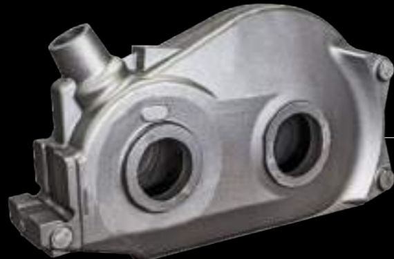
SCATOLA / housing