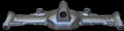
PONTE / axle