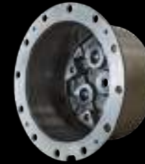
PORTASATELLITE / planetary carrier