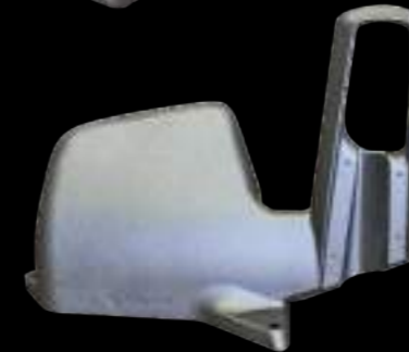
SUPPORTO / frame