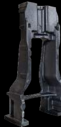
ZAVORRA / counterweight