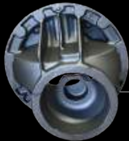
CARRIER / carrier