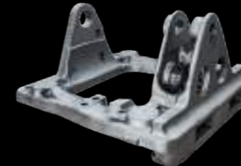
PIASTRA / sliding plate