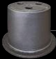
PORTASATELLITE / planetary carrier