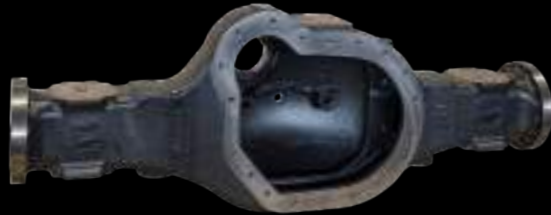
PONTE / axle